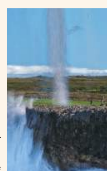
Bufones de Pría