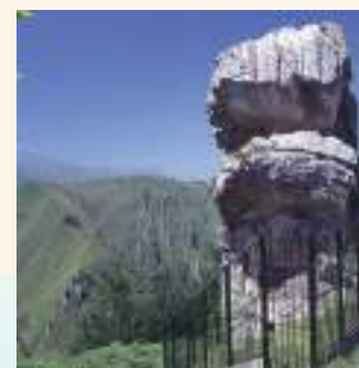
Idolo de Peña Tú

Recorriendo la costa del Concejo de Llanes nos encontramos con playas y calas, algunas escondidas, otras más urbanas. Si nos perdemos por sus montes conoceremos pequeños pueblos y aldeas donde la piedra y la madera se unen para formar conjuntos de arquitectura popular.