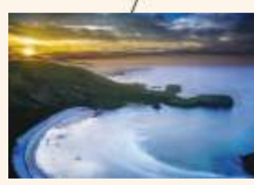
Playa de Torimbia

Buelna. - Palacio del Conde del Valle de Pendueles (S.XVIII), torre románica adosada a su Casa Concejo, complejo de Cobijero, de acceso peatonal y declarado Monumento Natural. Arquitectura popular. Playa. En las inmediaciones el Bufón de Santiuste.