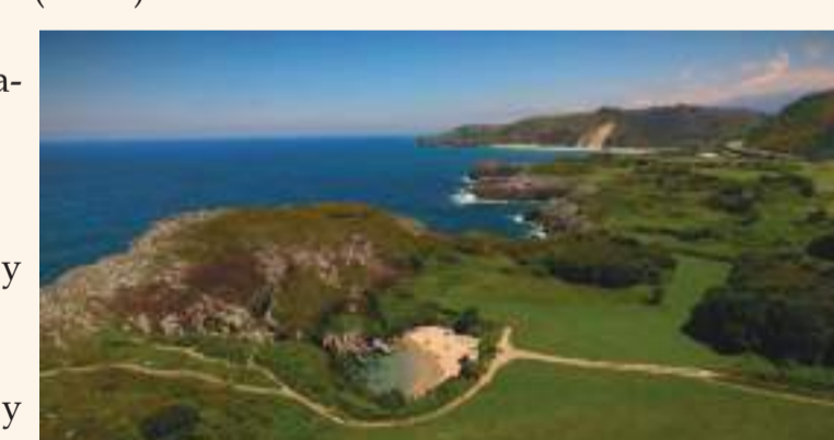
Playa de Gulpiyuri, (Monumento Natural)