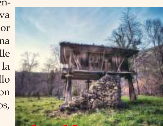
Palacio de Partarri, donde se rodó "El Orfanato"

En Santa Eulalia comenzamos otra ruta alternativa que nos lleva hacia el interior oriental del Concejo, una zona conocida con el nombre de "Valle Oscuro". Aquí disfrutaremos del paisaje y entorno rural visitando Pie de la Sierra, Tresgandas y el hermoso pueblo de La Borbolla que cuenta con un bello paraje: el nacimiento del río Abra. En estos pueblos nos encontraremos con conjuntos de arquitectura popular o elementos etnográficos como lavaderos, fuentes, etc. y algunas muestras de Casonas de Indianos.