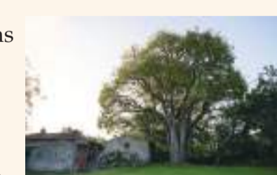
Museo Etnográfico del Oriente de Asturias